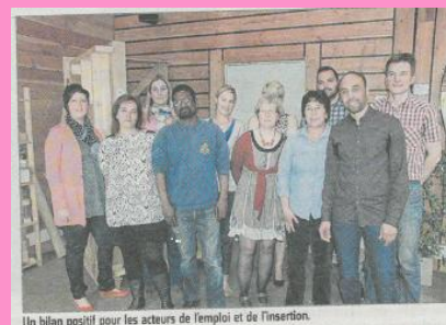
Un bilan positif pour les acteurs de l'emploi et de l'insertion.

34 personnes ont été accueillies en immersion d'une journée dans les 19 entreprises du secteur. La semaine de l'Industrie permet aux demandeurs d'emploi de découvrir l'activité et les métiers des entreprises industrielles de son secteur géographique.