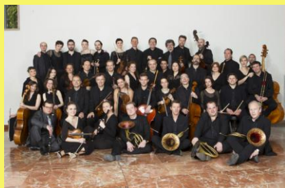
Photo le Concert d'Astrée