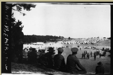
Fonds Caron, Vue du camp britannique vers Blanc Pavé, négatif sur plaque de verre ©Musée Quentovic-Ville d'Etaples