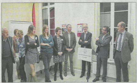
Les membres de petite équipe du Syndicat Mixte du Pays du Montreuillois a rappelé les missions qui leur incombent.